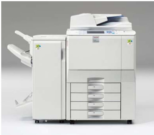
写真はフィニッシャーが装着されています。

お問い合わせ先 (株)リコー お客様相談センター 050-3786-3999 http://www.ricoh.co.jp/